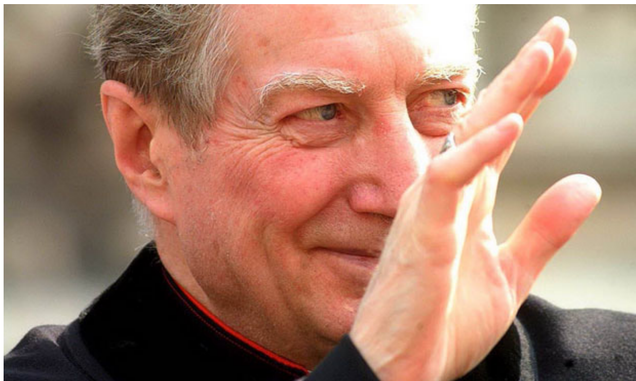
Card. Carlo Maria Martini

Noi e l'Islam. Un testo, prima ancora una riflessione, che il Cardinal Martini poneva all'attenzione della comunità cristiana e civile di Milano nel 1990. Visto quanto scrive e il modo in cui lo propone direi profetico. Un uomo e un pastore capace di farsi interrogare e interpellare da quanto sta accadendo nella società con grande lucidità e con grande coraggio, non eludendo le domande più difficili e spinose, e leggerlo alla luce della Parola. Profetico e dunque attuale perchè pone interrogativi e linee di riflessione su aspetti fondamentali che molto dicono anche a noi oggi.