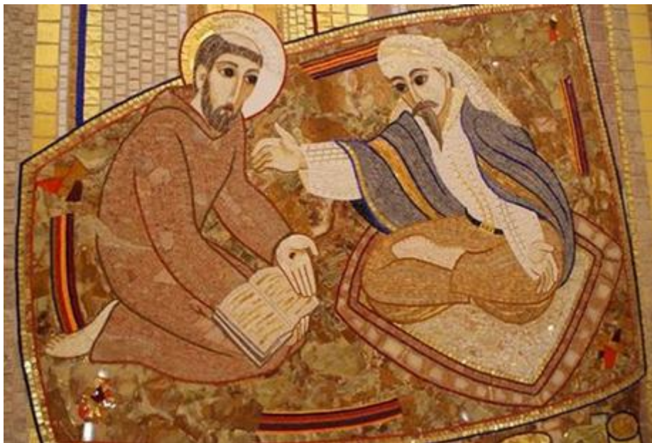
Francesco d'Assisi e il Sultano